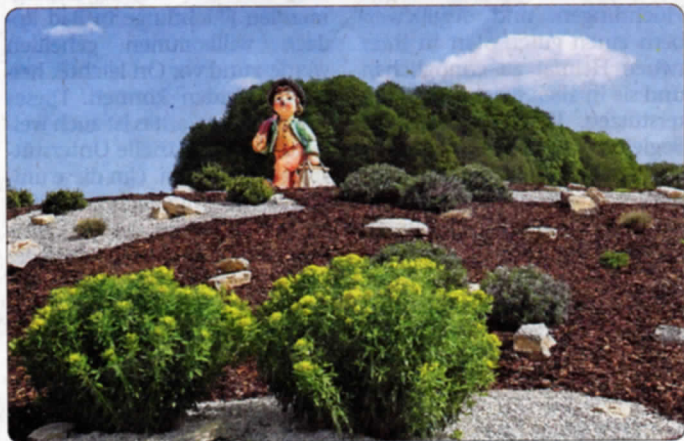
Der Wanderbursche auf dem Goebel-Kreisel.

Montag – Freitag 7.30 – 12 Uhr Montag und Donnerstag 13.30 – 16 Uhr Mittwoch 13.30 – 18 Uhr